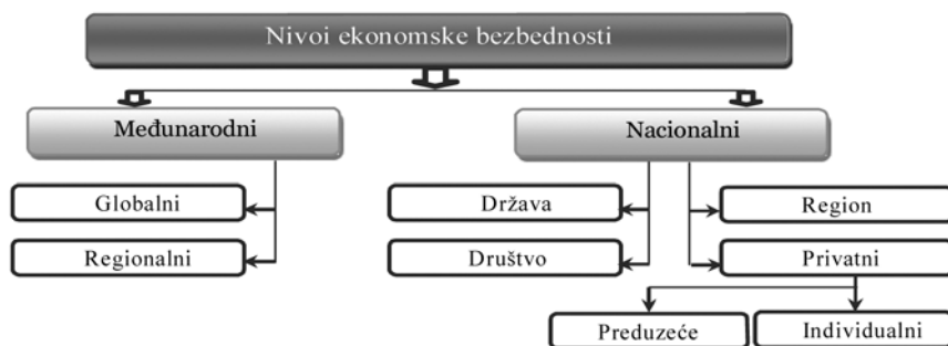
Slika 1. Nivoi ekonomske bezbednosti

Izvor: Ianioglo Alina, Polajeva Tatjana (2016): "Origin and Definition of the Category of Economic Security of Enterprise", 9 th International Scientific Conference, "Business and Management 2016", May 12–13, 2016, Gediminas Technical University, Vilnius, http://bm.vgtu.lt/index.php/verslas/2016/paper/viewFile/47/47 (27.08. 2017.).