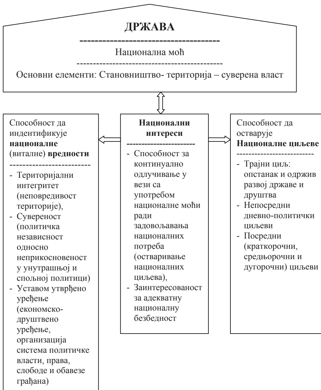
Слика 1. Структура националне моћи