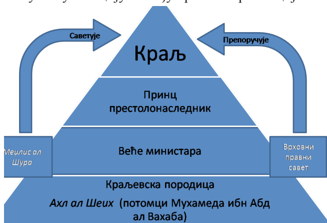
(Саудијска пирамида моћи)

слова, који предлоге даље прослеђује Већу министара. У пракси је, међутим, овај ланац надлежности много једноставнији и своди се на директну комуникацију између краља и провинцијских емира.